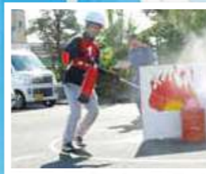
写真は前回大会の様子です。