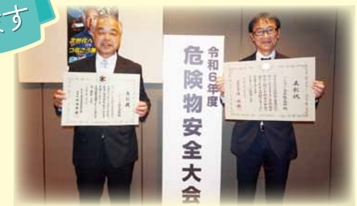
全国危険物安全協会理事長表彰 優良危険物関係事業所 ダイイチ株式会社

6月3日(月)に東京都港区の「ニッショーホール」にて令和6年度優良危険物関係事業所消防庁長官表彰と全国危険物安全協会理事長表彰がありました。積極的に危険物の安全管理の推進に努め、地域貢献や行政・協会の発展への協力、国民生活の安全の確保に顕著な功績のあった事業所として、当協会会員の方々を受賞されました。