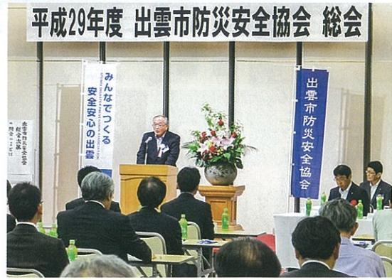
平成29年度 出雲市防災安全協会 総会

5月12日(金)、出雲市今市町ラピタウェディングパレスにおいて、平成29年度総会が開催されました。28年度行事及び決算報告並びに29年度の行事及び予算案が議事につけられ、いずれも満場一致で承認されました。